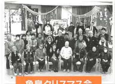
魚島クリスマス会