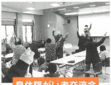
身体障がい者交流会