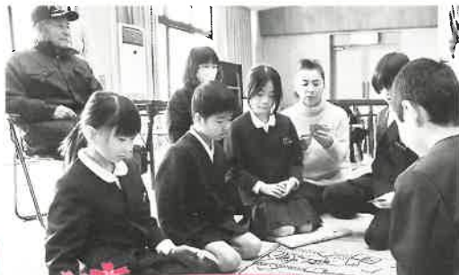
みんなでかるた勝負