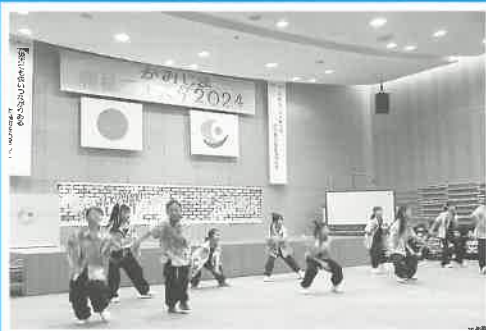
▲WakuWaku オールスターズダンスステージ

他にも、体験交流室では、地域包括支援センターによる介護予防教室、子育てサロンおひさまによる託児コーナーや友愛の水記念公園では、地域団体による出店などの催しに多くの方が集まり、盛会のうちを終了しました。