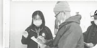
▲上島町地域包括支援センター介護予防教室