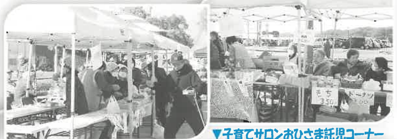
▼子育てサロンおひさま託児コーナー