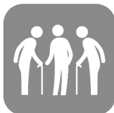
高齢者向けサロン