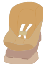
チャイルドシート