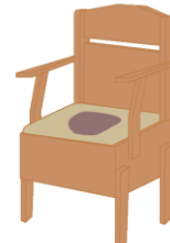
ポータブルトイレ