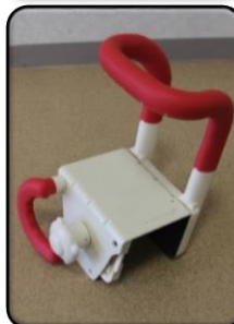
登録番号 226 シャワーチェア